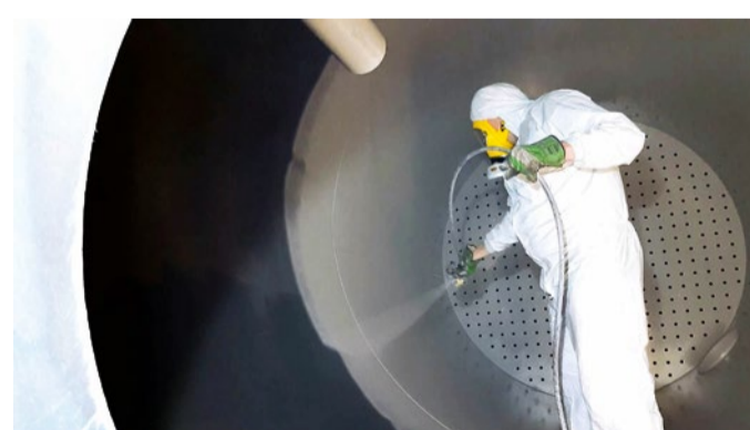
Die Beschichtung lässt sich im Airless-Spritzverfahren applizieren und weist eine hohe Abriebfestigkeit auf.

ratur von 30 °C einem Betriebsdruck von 6 bar standzuhalten. Um einen dauerhaften Werterhalt der Tanks sicherzustellen, muss die im Innenbereich aufgetragene Beschichtung herausragende physikalische Eigenschaften aufweisen. Das Hauptaugenmerk lag hier auf einer äußerst hohen Abriebfestigkeit, da Kies, Sand und scharfkantige Aktivkohlepartikel durch stetige Reibung immense Abrasion verursachen können. Zum Einsatz kam „Proguard CN 200“ aus dem Haus Ceramic Polymer. Die lösemittelfreie und keramikgefüllte Beschichtung bietet neben chemischer Resistenz und Temperaturbeständigkeit auch eine starke Widerstandsfähigkeit gegen Abrieberscheinungen, die bei den Filtertanks für die Kies- und Aktivkohlefiltration besonders wichtig ist.